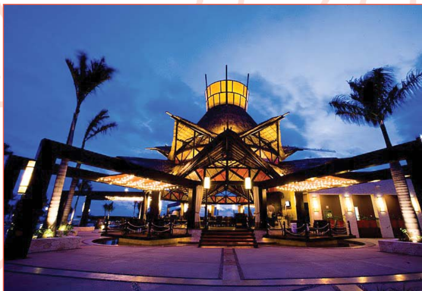
Restaurante Zama de noche.

memorable debajo de las estrellas que usted y su amado mantendrán en sus corazones por siempre.