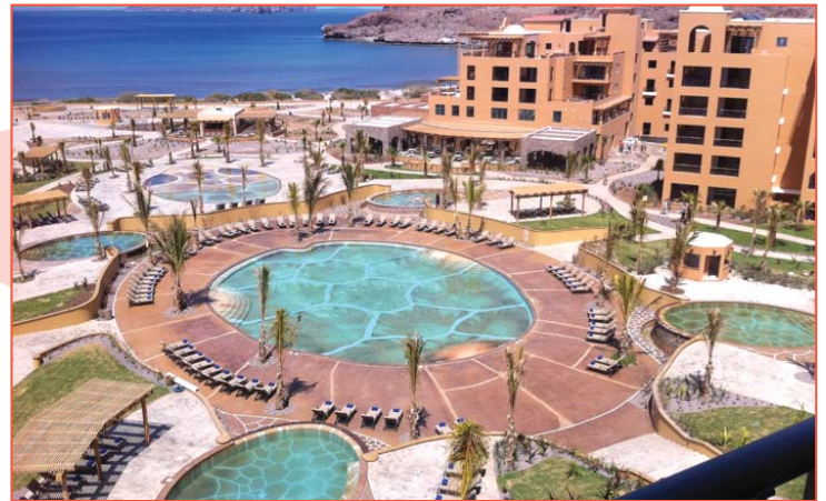
Villa del Palmar Loreto

Villa del Palmar Loreto – la belleza rústica de Loreto es su convincente característica y con los grandes paquetes de viaje que el resort ofrece, usted puede visitar Villa del Palmar Loreto varias veces y nunca tendrá la misma experiencia dos veces. Los tours están disponibles 8 días/7 noches o 4 días/3 noches. Si quiere una aventura memorable, solo elija uno de estos emocionantes paquetes: