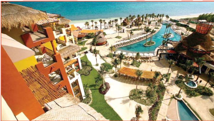
Villa del Palmar Cancun

"El servicio en este lugar es asombroso; todos son amistosos y quieren que disfrute de un gran momento si así lo desea. El personal está trabajando duro y pienso que tienen uno de los mejores programas que he visto."