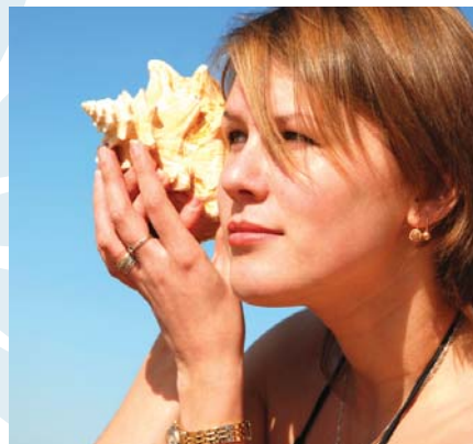
Close ups and people make the shot more interesting.

mejores resultados, póngase dando al sol para que éste dé en su hombro. No sea tímido pidiéndole a un extraño que tome una foto de ustedes dos juntos. No esfuércese en tomar fotos a diferentes horas del día. Después del amanecer y antes del atardecer proporcionará imágenes dramáticas.